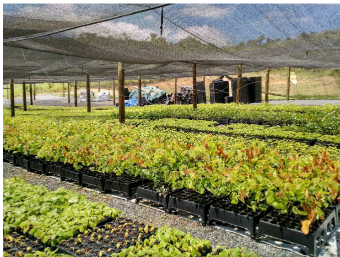
Figura 2: Viveiro de mudas no assentamento Nova Conquista II – Campo do Meio-MG.

Fonte: Deivison Samuel Pereira de Alfenas, 01/02/2018.