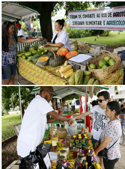
Figuras 3 e 4 - Inauguração da Feira Agroecológica e Cultural de Alfenas (FACA), em Alfenas-MG (22/02/2017).